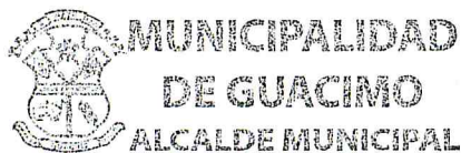
JUAN MANUEL CORDERO Ministro a.i.